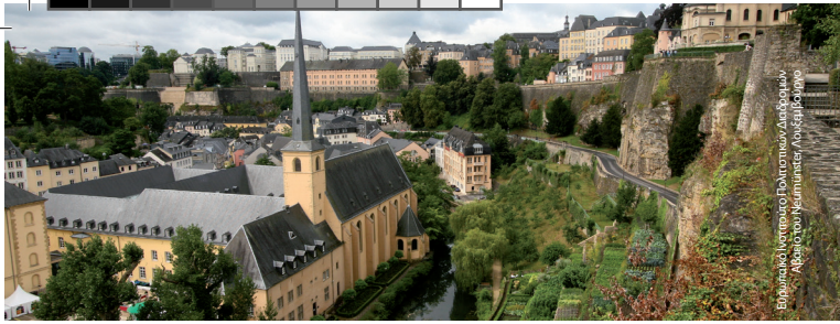
Ευρωπαϊκό Ινστιτούτο Πολιτιστικών Διαδρομών Αβείο του Neumünster, Λουξεμβούργο